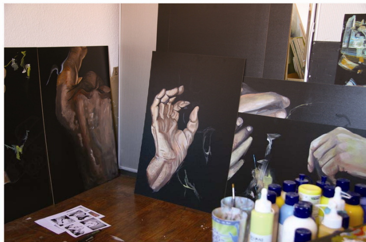
ohne titel 2010 acryl auf hartfaserplatte

Name: annemarie lischka Geburtsjahr + Ort: darmstadt E-Mail: annemarie2204@web.de Klasse: malerei