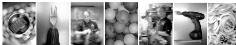
Küchenkomplott Fotoserie / 9-teilig