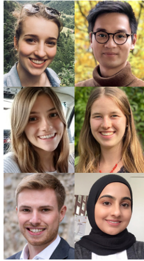
Zwei von vielen positiven Rückmeldungen unserer Stipendiatinnen und Stipendiaten.

„Vielfalt und Inklusion zu fördern gehört für uns bei Freshfields zu unserem Selbstverständnis. Der beste Zeitpunkt, die richtigen Dinge zu tun, ist immer jetzt. Daher freue ich mich sehr, dass wir Studierende mit Migrationshintergrund ab sofort besonders unterstützen.“