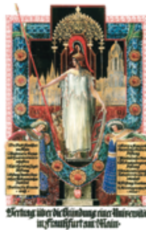
Schmuckblatt des Vertrags zur Gründung der Universität am 18. Oktober 1914

Auch die erste Frankfurter Bibelnacht, der internationale Alumniball, das Fest für Bürger und Angehörige der Universität sowie die lange Nacht der Literaturen gehören zu den Höhepunkten. „Der ganze nächste Sommer ist eigentlich ein großes Fest“, sagt Hornung. Die ‚Week of Science‘,