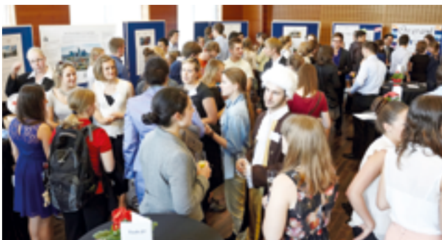
Ein Grund zum Feiern für Stipendiaten, Förderer, Mentoren und für die Universität: Das Förderkonzept der Goethe-Universität erreicht den ersten Platz im bundesweiten Wettbewerb.